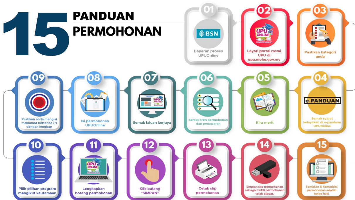
Gambar Rajah 1 : Panduan Permohonan Sesi Akademik 2025/2026